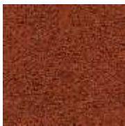
rotbraun / red brown