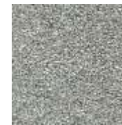
silber / silver