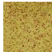
EPDM ocker-rot EPDM ochter-red