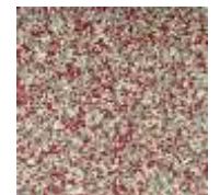
EPDM rot-weiß-grau EPDM red-white-grey