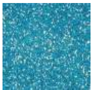
EPDM blau-weiß EPDM blue-white