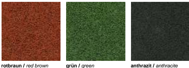
rotbraun / red brown grün / green anthrazit / anthracite