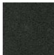
anthrazit / anthracite