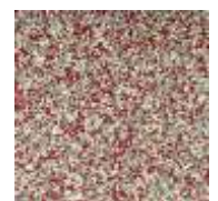
EPDM rot-weiß-grau EPDM red-white-grey