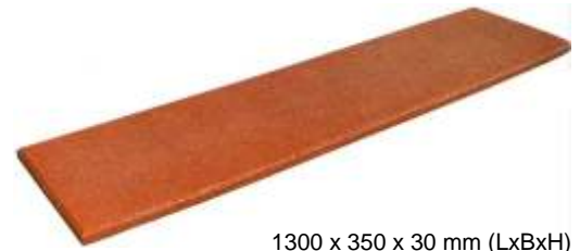
1300 x 350 x 30 mm (LxBxH)

Stair treads are suitable for the design of outdoor stairs as well as for the renovation of staircases.