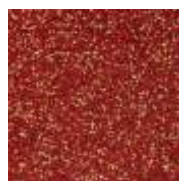
EPDM rot-ocker EPDM red-ocher