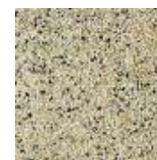
EPDM ocker-weiß-schw. EPDM ochre-white-black