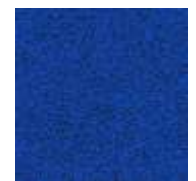
blau / blue