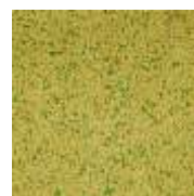
EPDM ocker-grün EPDM ochre-green