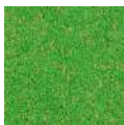
EPDM grün-ocker EPDM green-ocher