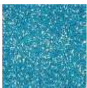
EPDM blau-weiß EPDM blue-white