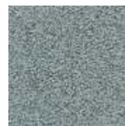
grau / grey