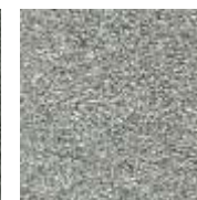
silber / silver