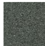
metallic / metallic