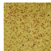
EPDM ocker-rot EPDM ochre-red