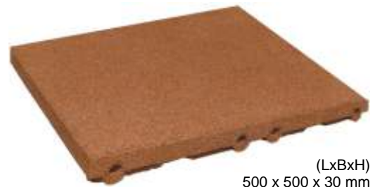
(LxBxH) 500 x 500 x 30 mm