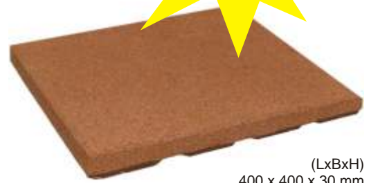
(LxBxH) 400 x 400 x 30 mm