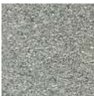
silber / silver