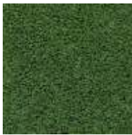
grün / green