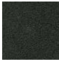
anthrazit / anthracite