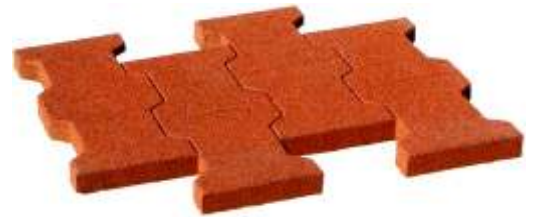
(LxBxH) 500 x 565 x 23 mm

These form locking paving slabs are easily installed and are suitable for creating path areas in land used for livestock as well as path areas, or asphalt surfaces in need of renovation. (36 single elements correspond to one square meter)