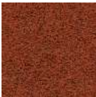
rotbraun / red brown