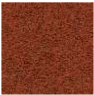
rotbraun / red brown