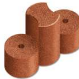
(LxHxB) 650 x 400 x 250 mm

Chain element 65 can be used a flexible sand pit bordering, securing sloping terrain and edge bordering for play-, sport- and leisure areas. Through a mounting tube the single elements are connected together (2,3 hrs per running meter).