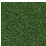
grün / green