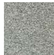
silber / silver