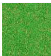
EPDM grün-ocker EPDM green-ocher