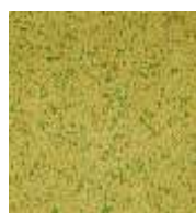
EPDM ocker-grün EPDM ochre-green