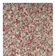
EPDM rot-weiß-grau EPDM red-white-grey