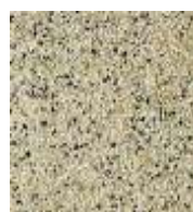
EPDM ocker-weiß-schw. EPDM ochre-white-black