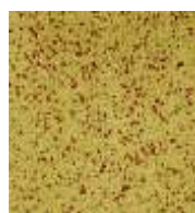
EPDM ocker-rot EPDM ochre-red