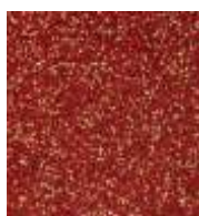
EPDM rot-ocker EPDM red-ocher