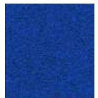
blau / blue