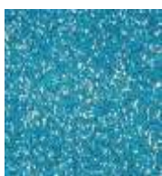
EPDM blau-weiß EPDM blue-white