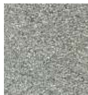
silber / silver