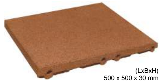
(LxBxH) 500 x 500 x 30 mm

Elastic terrace slabs of coloured rubber granule, include drainage and system plugs. The colors grey, metallic, silver and blue are spray coated. (surface top sealers)