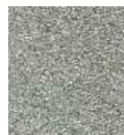
silber / silver