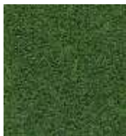
grün / green