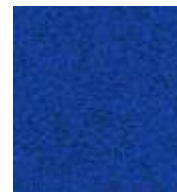
blau / blue