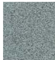
grau / grey