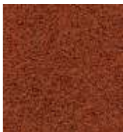
rotbraun / red brown