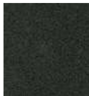
schwarz / black