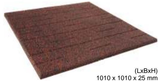
(LxBxH) 1010 x 1010 x 25 mm

Balcony mats made of coloured rubber granule 1010 x 1010 x 25 mm, include drainage of underside the mat.