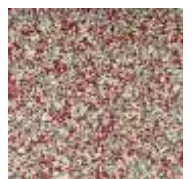
EPDM rot-weiß-grau EPDM red-white-grey