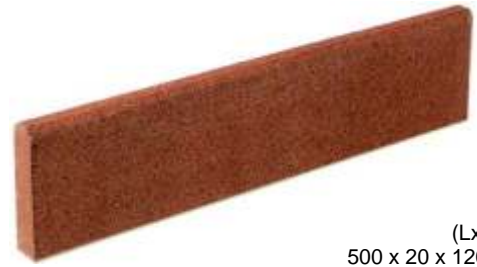
(LxBxH) 500 x 20 x 120 mm

Plinths are screwed on the walls and serve an visual closure of balcony and terrace floorings.