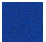
blau / blue