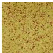
EPDM ocker-rot EPDM ochter-red