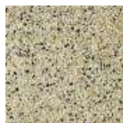
EPDM ocker-weiß-schw. EPDM ochter-white-black